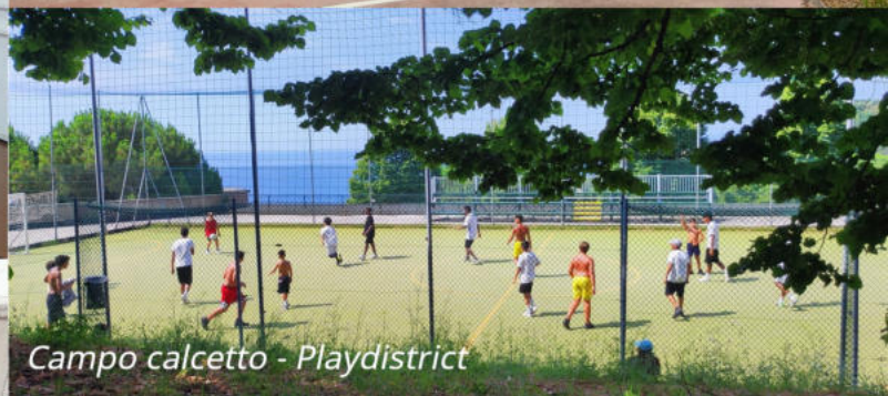
Campo calcetto - Playdistrict