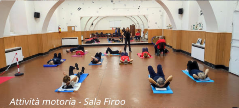
Attività motoria - Sala Firpo