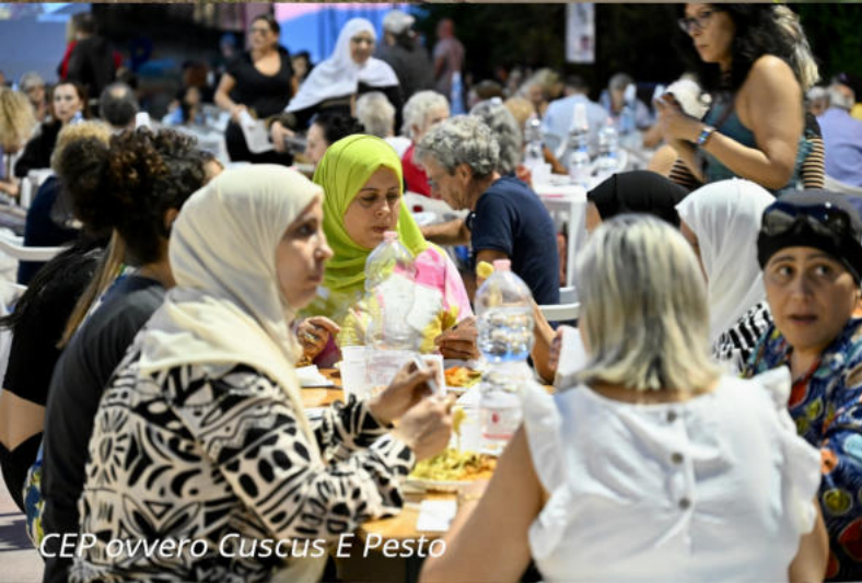
CEP ovvero Cuscus E Pesto