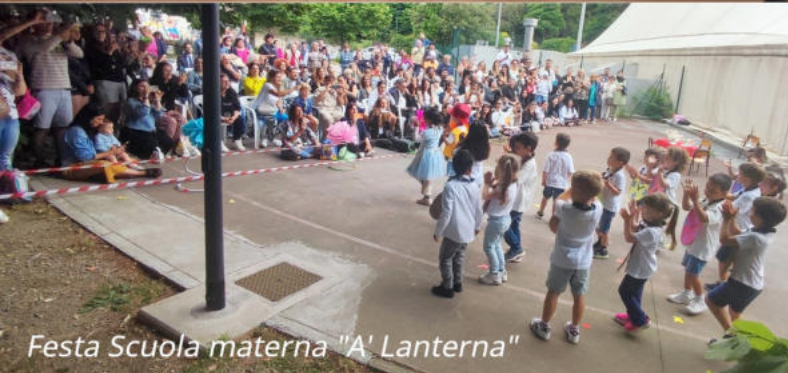
Festa Scuola materna "A' Lanterna"