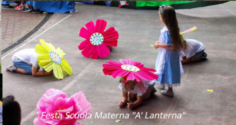
Festa Scuola Materna "A' Lanterna"