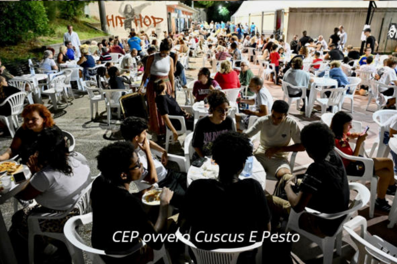
CEP ovvero Cuscus E Pesto