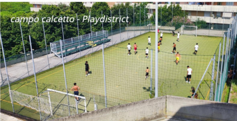
campo calcetto - Playdistrict