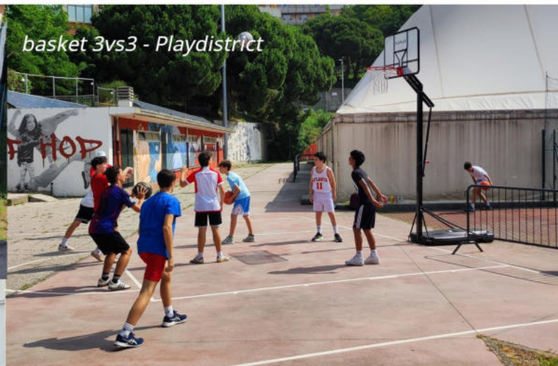
basket 3vs3 - Playdistrict