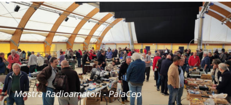
Mostra Radioamatori - PalaCep