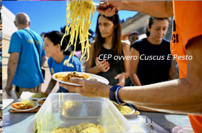
CEP ovvero Cuscus E Pesto