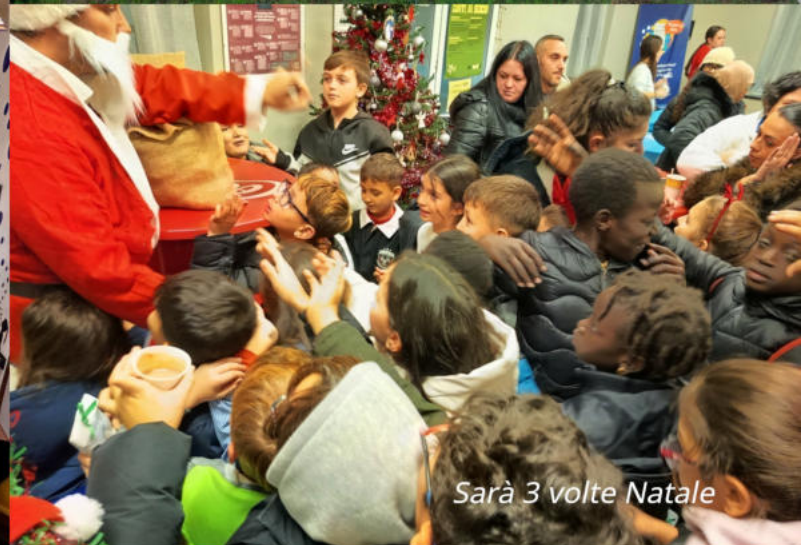
Sarà 3 volte Natale