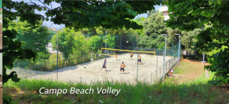
Campo Beach Volley