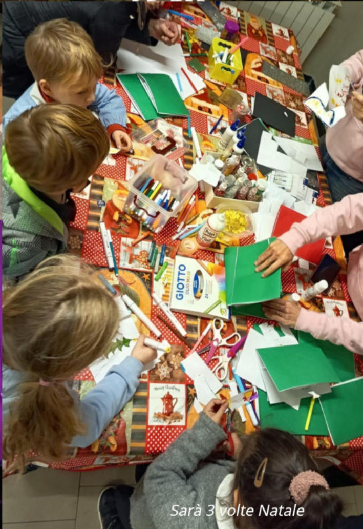
Sarà 3 volte Natale